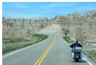
Badlands National Park