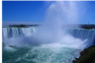
Cataratas del Niágara