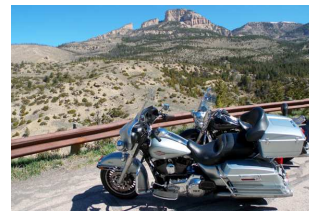
Big Horn Mountains