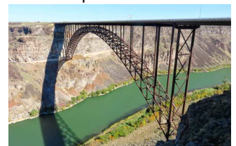
El Cañón del río Snake