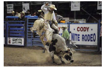
Un auténtico rodeo