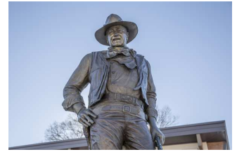
La casa natal de John Wayne