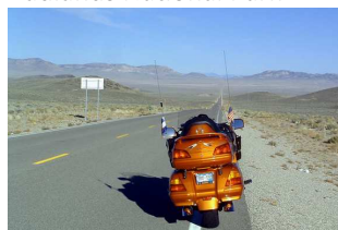
La carretera más solitaria