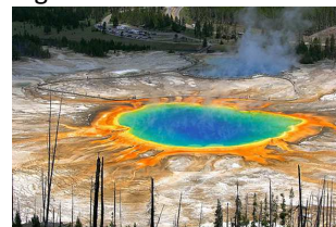
Yellowstone National Park